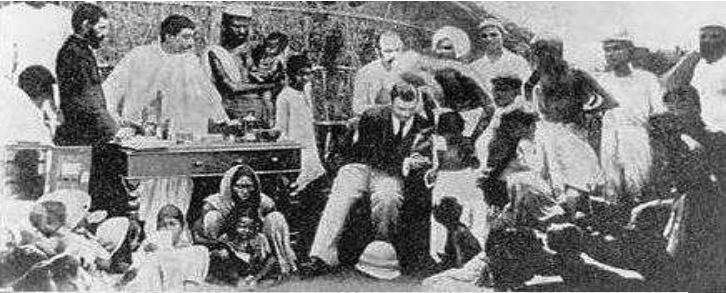
Il Dr. W. M. Haffkine inizia, nel marzo 1894, le vaccinazioni anticolicerliche in India.

காமாவின் தந்தை அவரை மேல் படிப்புக்காக லண்டன் அனுப்புவது மூலம், அவருக்கு நல்ல சிகிற்சை அளித்து அவரது கவனத்தை இந்தியப் போராட்டங்களில் இருந்து திசை திருப்பிவிடலாம் என்று எண்ணினார். ஆனால் அம்மையார் வெளிநாட்டிலிருந்து சுதந்தரத்திற்காகத் தன்னை எவ்வாறு முழுமையாக ஈடுபடுத்திக் கொண்டார் என்பதை பின்னர் காண்போம். (தொடரும்)